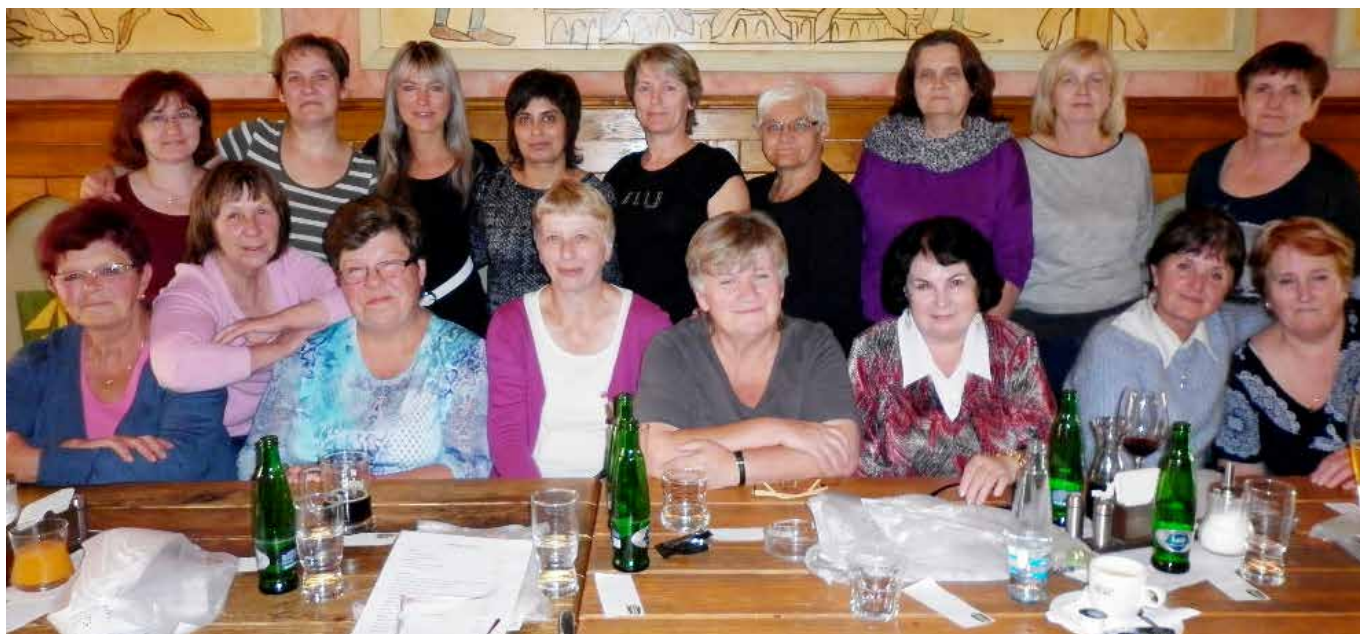
Ukončení cvičebního roku ženy + zdrávko 23. 6. 2015