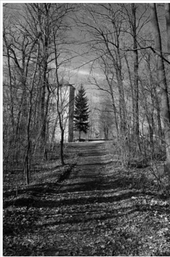
Ukázka z tvorby „Bobajse“

Novodvorskému fotografovi „Bobajsovi“ k obsazení 3. místa v celostátní fotografické soutěži „Památná místa 2.světové války očima seniorů“, která byla vyhlášena Svazem důchodců ČR.