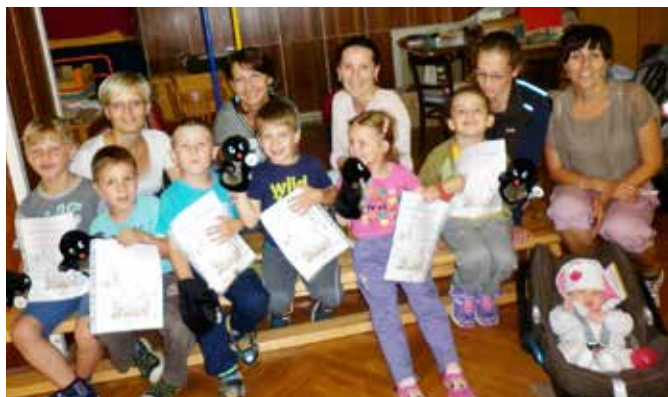
Po ukončení cvičebního roku září 2014 - červen 2015