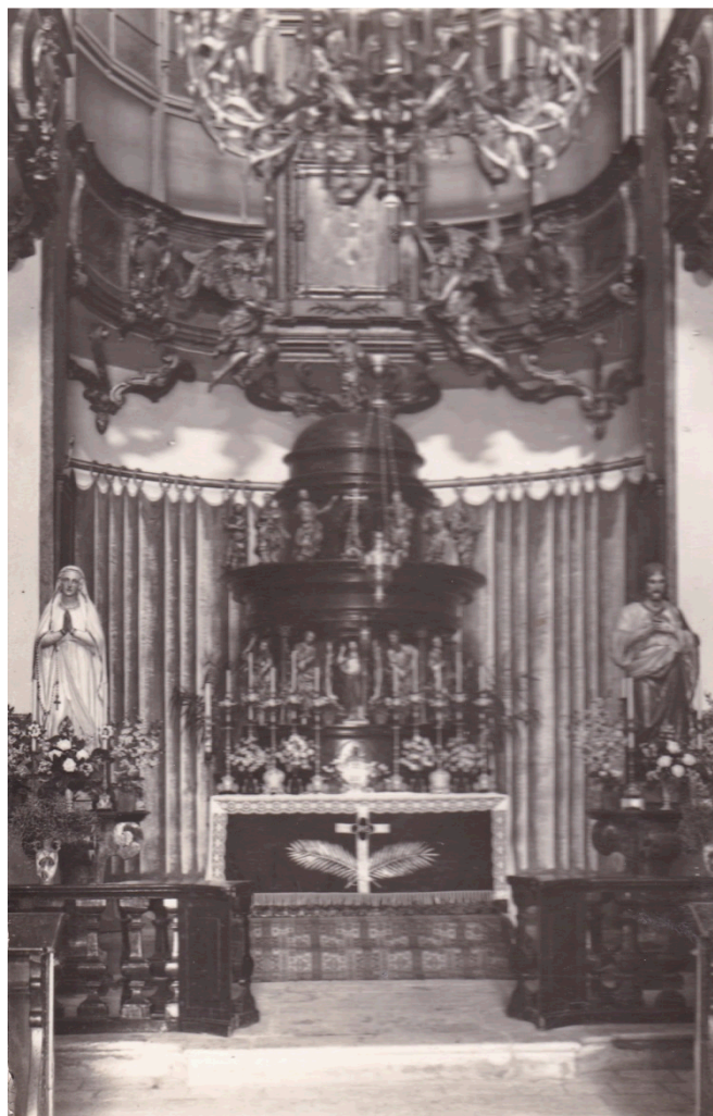
Hlavní oltář v kostele sv. Anny v Nových Dvorech

V roce 1754 opět císařská armáda ve stejné krajině znovu uspořádala podobné vojenské cvičení. Opět 17. srpna přijela navštívit toto cvičení i Marie Teresie s manželem. Když se pak manželé z vojenského tábora vraceli do Nových Dvorů, byli uvítáni výtečnou hudbou a nevídaným osvětlením. Osvětlen byl i kostel sv. Anny, a to celá kupole, pak obě věže odzvola až nahoru, jakož i průčelí residenčních střech směrem k zahradě. Spotřebováno bylo velké množství svítilen plněných olejem. V Nových Dvorech se zdrželi manželé až do 23. srpna, kdy po ranní mši u sv. Martina odjeli do Prahy.