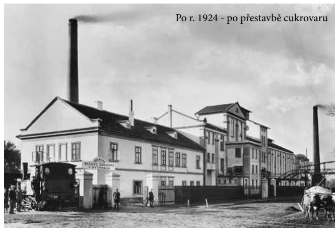
Po r. 1924 - po přestavbě cukrovaru

Vlastní železniční vlečka do stanice Sedlecké, 1,8 km dlouhá, byla postavena r. 1883. Lokomotiva bývala první léta ředitelstvím dráhy vždy na kampaň zapůjčována; mimo kampaň děla se doprava vagónů k hlavní trati a zpět cukrovanskými potahy. Během času byla vagónová doprava značně zdokonalována a cukrovar vlastnil 2 lokomotivy a 12 vagónů.