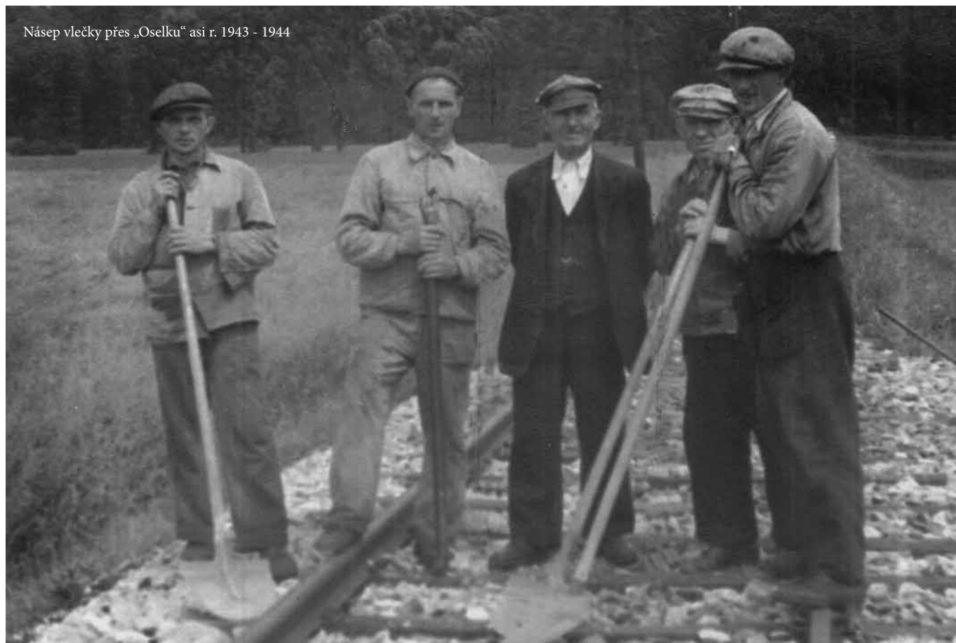
Násep vlečky přes „Oselku“ asi r. 1943 - 1944

Trať vedla přes dva mostky v oboře – přes náhon do Kovářského rybníka a náhon ústící do říčky Klejnarky nedaleko vodárny. Dále pokračovala po náspu přes „Oselku“, ve kterém byly čtyři mostkové propusti a následoval velký most přes říčku Klejnarku.