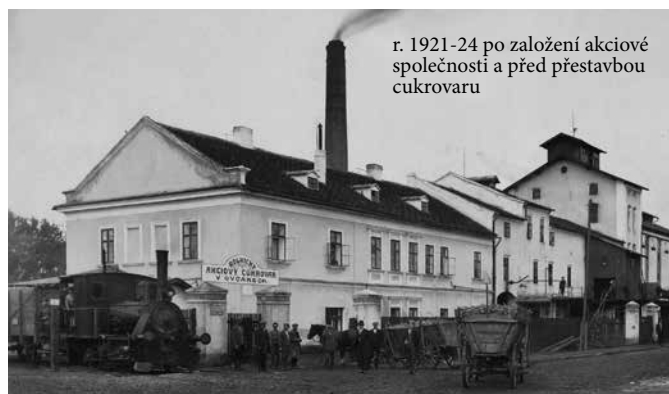
r. 1921-24 po založení akciové společnosti a před přestavbou cukrovaru

klukovský název pro lokomotivu ovčáreckého cukrovaru, která zajišťovala přepravu na železniční vlečce do železniční stanice Kutná Hora-Sedlec. Podle pana Otakara Pavláška, autora webových stránek „Atlas parních lokomotiv“ ji vyrobila lokomotivka Krauss&comp Mnichov v roce 1881.